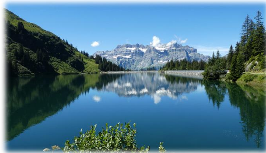
Garichtisee auf Mettmern