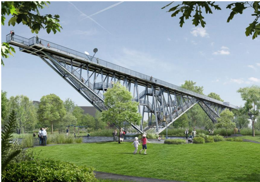
Technorama Winterthur Technorama-Park mit Wunderbrücke